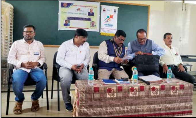
3rd Zonal review in Kadamba, Shikaripura